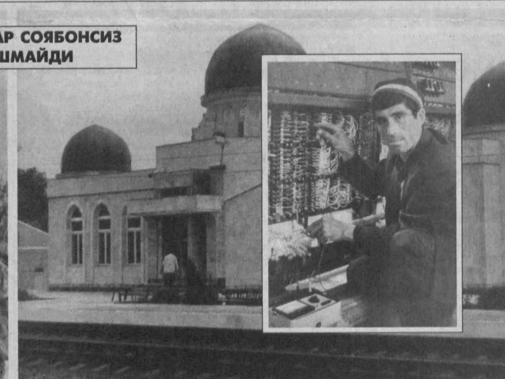
ЙЎЛОВЧИЛАР СОЯБОНСИЗ ҚОЛИШМАЙДИ

«Ўзбекистон темир йўллари» компаниясининг Фарғона бўлими масофаларида янги бекатлар қурилиб, бирин-кетин фойдаланишга топширилмоқда. Яқинда Андархон қишлоғидаги 136-разъездада қурилиб йўловчилар хизматига тақдим қилинган бекат буюк аллома Аҳмад ал-Фарғонийнинг 1200 йиллик тўйига бағишланди. Бекатни Фарғона фуқаро иншоотларини қуриш корхонасининг қурувчилари бунёд қилдилар. Шунингдек, корхона жамоаси Қувасой, Хонобод, Ҳўқўрғон шаҳарларида қурилган шохбекатларни ҳам республикамиз Мустақиллиги байрами кунига битказиб, фойдаланишга топширишга аҳд қилган. Ҳа, бундай фидойилар бор экан, йўловчилар ҳеч қачон соябонсиз қолишмайди.