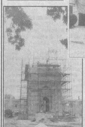
БОШ МИНОРА — ЭНГ МУҲТАШАМ КОПОНА

Бу йил кузда буюк ватандошимиз, ҳаёис илми султони Имом ал-Бухорий таваллудига 1225 йил тўғди. Шу муносабат билан ҳазрат хоки пойи мансу кўшим топган Челек туманидаги Хартанг қишлоғида кенг кўламли бунёдкорлик ва ободонлаштириш ишлари давом этмоқда. Эски масжид ва мақбара ўрнида ҳашаматли қопона — замонавий меъморилик намуналари билан уйғунлашган, қадимий миллий анъаналарни ўзида мужассамлаштирган бетакрор ёдгорлик мажмуаси бунёд этилаётган. 17,5 метр баландликка буй чўздиган бош минора қурилиши Самарқанд қурилиш-таъмирлаш бошқармасининг «Меъмор-96» қурилиш ташкилати бажаришда. Иш икки сенада ташкил этилган. Қурилиш материаллари узлуксиз етказилиб турилибди.