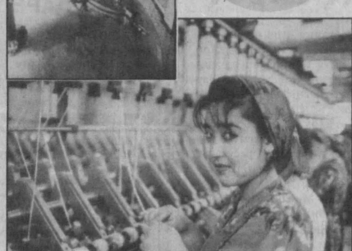
КИШЛОҚҚА САНОАТ КЕЛДИ

солиқ ва бошқа тўловлардан маълум муддатга озод қилмоқда. Тадбиркор учун, каттами, кичикми, бизнес билан шуғулланувчилар учун бундан ортиқ имтиёз бўлмас! Дарҳақиқат, республикамиз «Бизнес-фонд» ҳиссадорлик ҳимояти ва унинг виллоят бошқармаси томонидан 1995 йил октябрдан бошлаб, шу йил майгача қадар виллоят буйича 214 та лойиҳа учун 194,5 млн. сўмдан ортиқ кредит ресурслари ажратилган. Жумладан, қишлоқ ҳўжалик маҳсулотларини қайта ишлаш учун 24 та лойиҳага 37,7 млн. сўм, деҳқон-фермер ҳўжаликларини ривожлантиришнинг гувоҳи бўлиб турибмиз.