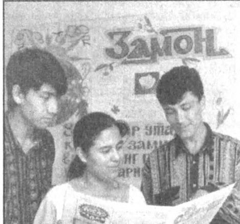
ЁЗ — ЎТМОҚДА СОЗ

Ўзбекистон Бадий академияси Сурхондарё вилоят ҳокимлиги билан биргаликда Вазирлар Маҳкамасининг 1998 йил 19 январь 17-қарори биноан «Алломчи» достони яратилганининг 1000 йиллигига бағишлаб, монументал паннолар учун очик танлов эълон қилади. Танлов шартлари: тақдим этиладиган монументал панно лойиҳалари «Алломчи» достони мавзусига бағишлангани, уларда мардлик ва она-Ватанга, халққа садоқат тинчлик сазовлари акс эттирилгани лозим. Асарлар тасвирий санъатнинг юксак талабларига жавоб бериши зарур. Монументал панно муаллифлари бир ёки бир неча ишкордан иборат бўлиши мумкин. Танлов муддати: 1998 йилнинг 20 августигача. Танлов ғолиблари учун куйидаги совринлар белгиланган: Битта биринчи мукофот 150000 сўм Иккита иккинчи мукофот 80000 сўмдан Учта учинчи мукофот 50000 сўмдан. Танловга тақдим этилган панно лойиҳалари Тошкент шаҳри, Шароф Рашидов кўчаси, 40-уй — Ўзбекистон Бадий академиясига йўлланди. Маълумот учун телефон: (8-3712) 56-50-47. Факс: 56-50-46.