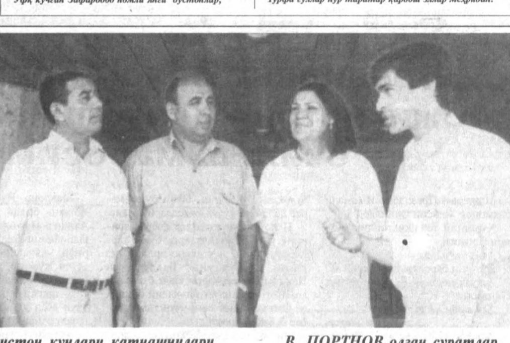
СУРАТЛАРДА: Тожикистон кунлари қатнашчилари.