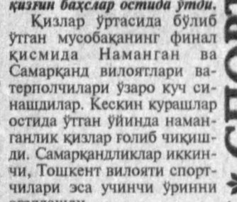
қизлик бахслар остида ўтди. Қизлар ўртасида бўлиб ўтган мусобақанинг финал қисмида Наманган қизлари билан Самарқанд виллоятлари ва терполчилари ўзаро куч си-нашдилар. Кескин курашлар остида ўтган уйинда наманганлик қизлар голиб чиқиди. Самарқандликлар иккинчи, Тошкент виллоятли спортчилари эса учинчи ўринни эгаллашди.

Республикамизда теннис, футбол каби спортнинг бошқа турлари ҳам кенг омиллашиб бормоқда. Яқинда Наманганда ўсмир-ёшлар ўртасида ватерпол бўйича мамлакат чемпионати бўлиб ўтгани ҳам фикримизнинг далилидир. Давлатбод туманидаги «Ёшлар» суҳбатида бўлиб ўтган ушбу мусобақада турли вилоятлардан келган, сараланган қизлар ва ўғил болалардан иборат спорт жамоалари иштирок этдилар. Беллашув