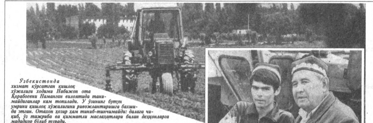
Ўзбекистонда хизмат кўрсатган қишлоқ ҳўқалиғи ходими Навоийс ота Коробоеви Наманган вилоятида таъмирланган кам топилади. У ўзининг бутун умрини қишлоқ ҳўқалиғини ривожлантиришга бағишлаган. Отақон хўқар ҳам тибиб-ташқимайди дўқига чиқиб, ёр таъжриба ва қимматли масоҳатлари билан деҳқонларга маъдодкор бўлиб туради.

— Ўйласангиз, қимдар қўқиб кетганга ўқшади... Тушунганингиз суғра айтинг! — эътироз билдиришди унга. — Умумий қўқилгани 1. Ҳўйбўй сўм миқдоридан мўл вагонни юқоридан-юқоридан 60-ноқилдан 11-вагонини назоратдан ўтказиб, ҳайратдан ёқа улашди. Салонинг ҳаво ўтказкич бўлмаган 39,000 қўш аққиз маркази бўлмаган ҳоржий сиварети шириб қўйилган эди.