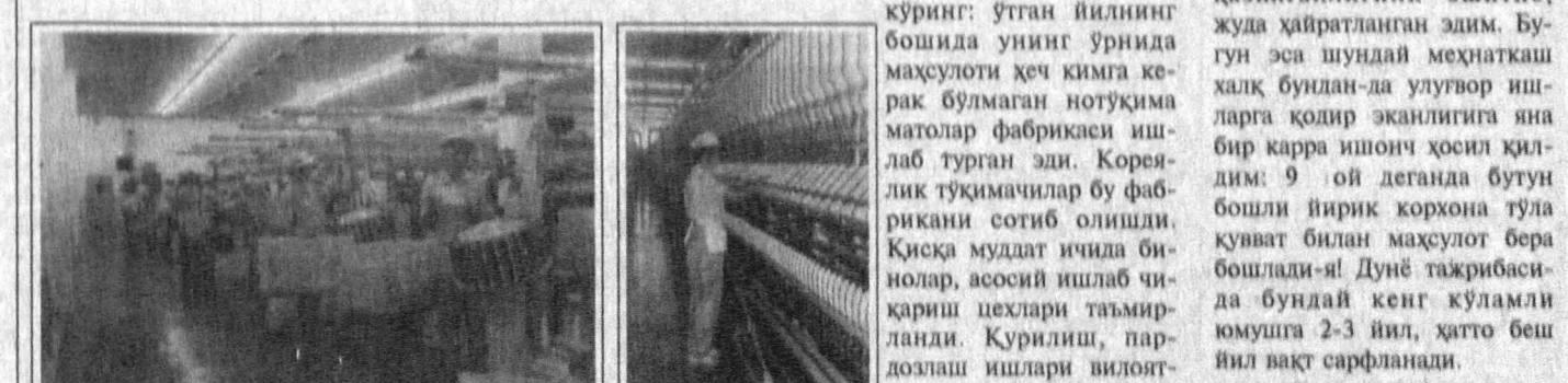
Тошлоғу Маргилон қўнғарида, тўқимачилари, шойин-атлас арибандчиликнинг доғруғи азалдан Маширқ мамлакатларида маълум ва машҳур эди. Шунинг учун бўлса керак, дунёга машҳур «ДЭУТекстайл» компанияси вакиллари ил-йигиру қорхонаси бунёд этиш ниётида мамлакатимизга келганларида, гўзал табиати, бой табиий ҳомашеби, айниқса, меҳнаткаш ва сажий кишилари бўлган Тошлоқ уларга маъқул бўлди. Шу тариқа, бу ерда қор