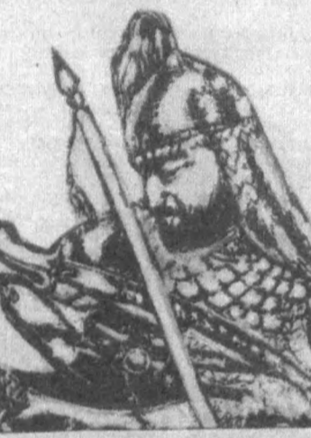
Ой Барчиним, ёр-ёр, Гул Барчиним, ёр-ёр. Ултонтоғга текканча Ул Барчиним, ёр-ёр...