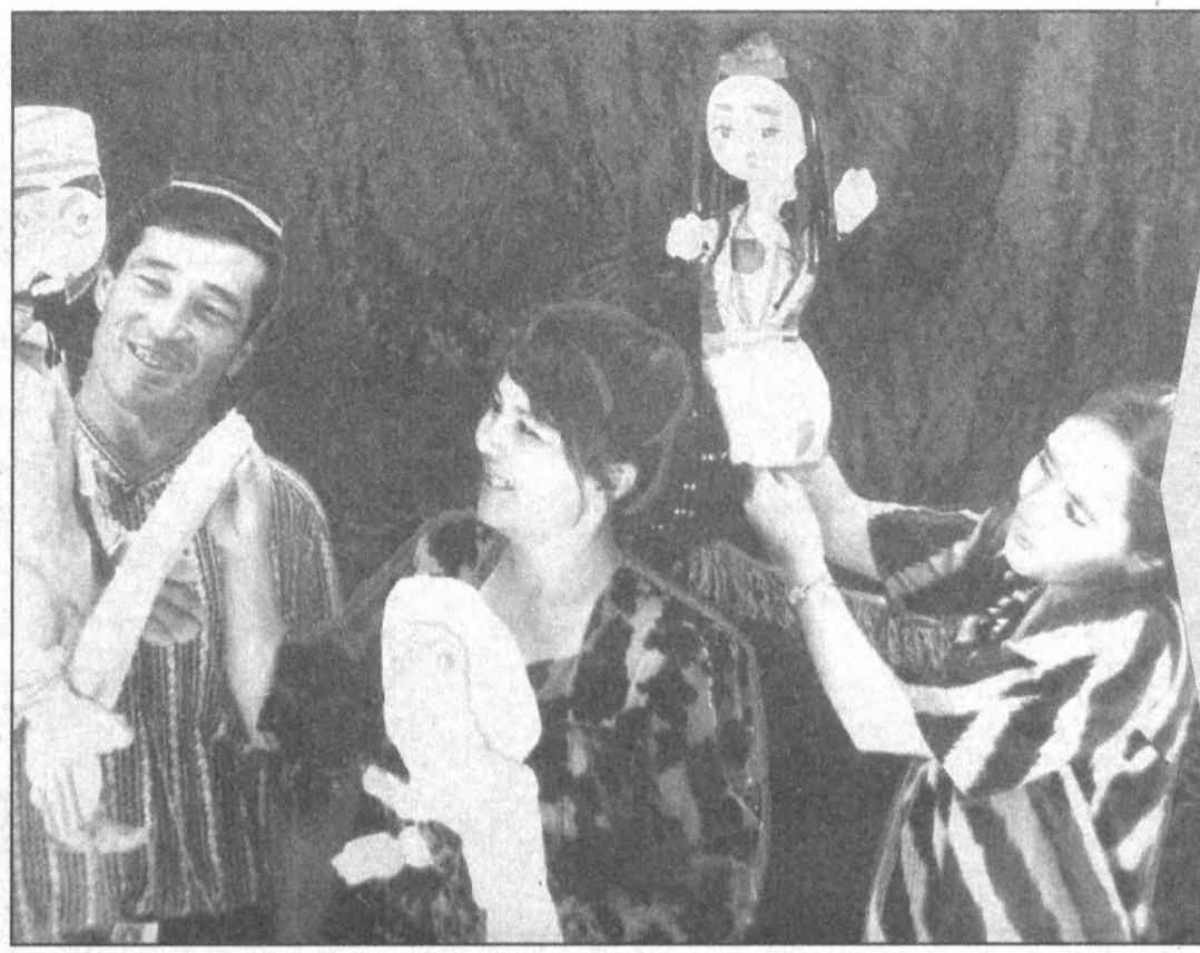
Учқўриқ туманида кўғирчоқ театри ташкил этилганига унча кўп вақт бўлгани йўқ. Шундай бўлса-да, театр болажонларимизнинг севимли максаитига айланган. Театр актёрлари ижросидаги «Навриддин афанди сарғушлария», «Елғончи ялмоғиз», «Сичқон ва мушук» каби спектакллар ёш тоmosабинларда катта таассурот қолдираётир.