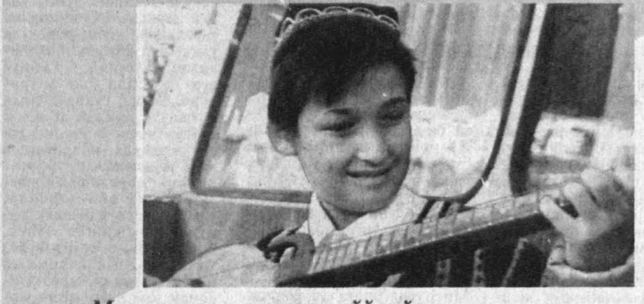
Мустақиллигимизни кўйлайман.

Жиззах вилояти Зарбдор туманидаги 1-сон умумтаълим мактаби она тили ва адабиёти, 3-сон умумтаълим мактаби рус тили, лицей-интернат эса математика фаһи бўйича ихтисослаштирилди.