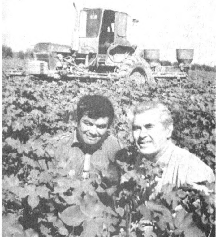
БОҒОТЛАНЛАР ТАЖРИБАСИ ҚҮЛ КЕЛМОҚДА

Устоз тренер шоғирини камолга етказишда у эгаллаши керак бўлган юксакликни кунма-кун, қаламба-қалам белгилаб боради.