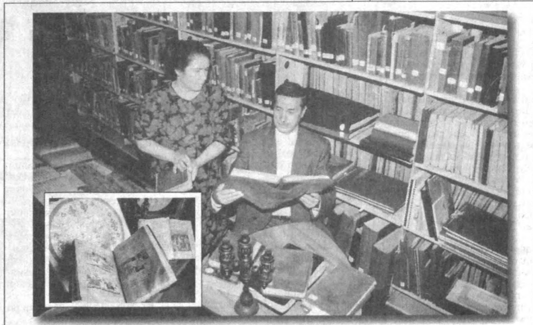
Аждодлар мероси — муқаддас!

малика билан сайёра Венера (Зухро) номи орасида сўз уйини ясаб, ёзди: