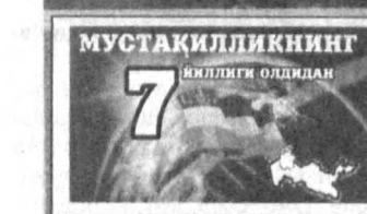
МУСТАҚИЛЛИКНИНГ 7 йиллиги олдидан

Ўзбекистонда боболар мероси қадр топиб, миллий маданият, миллий тарих асослари шакллана бошлади.