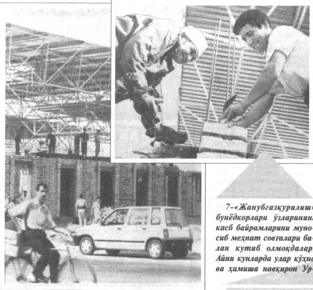
7-«Жанубгазурилиш» бунёдкорлари ўзларининг касб байрамларини муносиб меҳнат совғалари билан кутиб олмоқдалар. Айни кунларда улар кўна ва ҳамшира навқирон Урганч шаҳрида 720 ўрилли ёпиқ деҳқон бозори мажмуини барпо этишяпти. Бу ишдоом республика мустақиллиги 7 йиллиги шодиёналари арафасида фойдаланишга топширилди.

ИСТИҚЛОЛ ҚАЛҚИЙДИ УЙҒОҚ ҚўЗЛАРДА Широқ уйғонади эрқдил сўзларда, Фароғат сузади уйғоқ қўзларда, Истиқлол қалқийди ой юлдузларда, Бу кун тонлар отар, Озод, бошқача! Ешариб кетади кекса-ёшгача! Чўлпон... эй, наззора «фалаги тоза» Бу ёрқин давронни қон сиза-сиза, Томирида олиб келдилар биза, Бу кун субҳлар қулар хушхал, бошқача, Обод чайқалади, Гулдан тошгача! Мардона-мардона ўтган ботирлар, Миллат деб қон туғлаб Усмон Носирлар, Ана кўёш бўлаб келаеттирлар, Бу тонг қулар чиқар Чақнаб бошқача, Шодлаиб кетади душман-дўстгача! Етти йил еттига иқлимдай собит! Халқим мангу ёсин озодликдай УТ! Минг битта жонимни пойинга тўшаб, Жаннат боғларининг гулига ўхшаб, Бу кун тонлар отар, Шаффоф бошқача! Турлиб кетади жисми лошгача! Широқ уйғонади эрқдил сўзларда, Истиқлол қалқийди уйғоқ қўзларда... Озода БЕКМУРОДОВА.