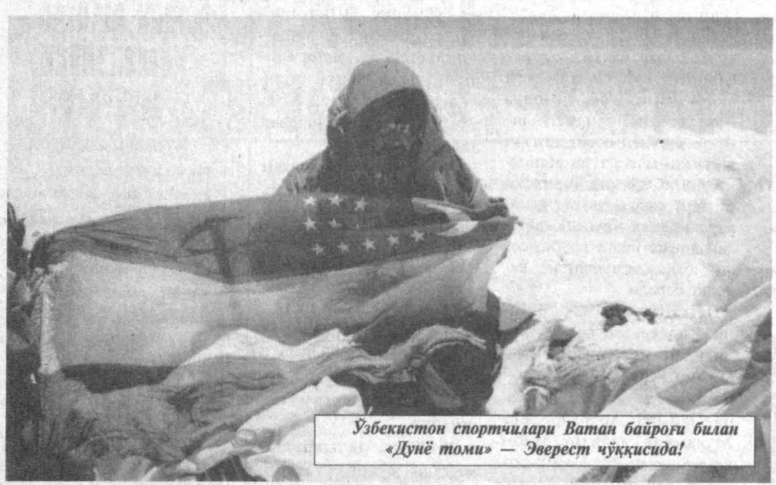
Ўзбекистон спортчилари Ватан байроғи билан «Дунё томи» — Эверест чўққисиди!

Дунёда инсониятнинг ўзи яратиб, ўзи лол қолган мўъжизалари оз эмас. Шулар орасида энг сирли-сехрли, ҳаяжонли эҳтиросли спорт бўлса керак. Спорт бир пайтнинг ўзида миллионлаб қалбларни ларзага солади, қувончу шодликларга чулғай олади.