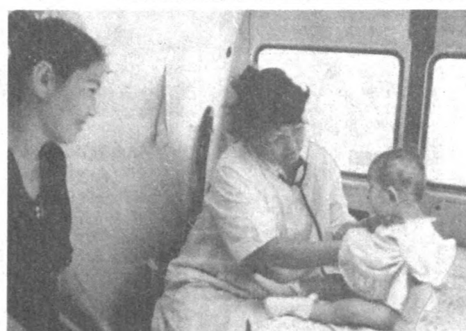
Халқимизда «Саломатлик — туман бойлик» деган нақл бор. Чиндан ҳам соғ-саломат юрсанг ҳамма нарса бадастир бўлади.

СУРАТЛАРДА: шифокорлар аҳоли орасида.