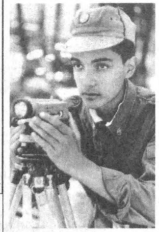
Қуроли Кучларимизнинг алоқалари ҳам йилдан-йилга ушиб, кенгайиб борапти. Вакилларимизнинг қатор йиллардан буён НАТОнинг «Тинчлик йўлида ҳамкорлик» дастури доирасида АҚШ ҳарбийлари билан мамлакатимизда ўтказилаётган «Ультраваланс» қўшма машқлари, ўтган йили дунёнинг 15 дан зиёд мамлакат вакиллари иштирокида ўтказилган «Марказий Осиёўлбатоли» — 97» ҳамкорлик машқлари фикримизнинг далилидир. Бундай ҳамкорлик машқлари ҳарбийларимизнинг кўникмаларини халқаро тажриба билан бойитиш имконини беришти ва ўз навбатида нафақат Ўзбекистон доирасида дунёга олиб чиқяпти, балки мамлакатимиз обрў-эҳтиборини жаҳон миқёсида тиклашга улуш бўлиб қўшилди. Буларнинг ҳаммаси юртимиздаги тинчлик ва осуда ҳаёт туфайлидир. Эндилкида дунё мамлакатларида Ўзбекистонга нисбатан Марказий Осиё худуди барқарорлик қафолати маркази сифатида муносабат, ишонч шаклланди. Бу ишонч, муносабат, албатта, мамлакатимизнинг халқаро алоқалари бундан-да кенгайиб боришига хизмат қилади. Ўзбекистон Қуроли Кучлари ана шу барқарорлик, осуда ҳаёт, халқимизнинг яратувчанлик ва бунёдкорлик меҳнатини қафолатлаб, мустақиллигимизни янада мустаҳкамлашга ва унинг равангага ўз улушини қўшиб келяпти. Ватан ҳимоясини муқаддас билдиб, бу йўлда ҳаёт жонини ҳам аямаган аждоғларимизнинг кутулғу ананаларини давом эттиряпти.

биринчи навбатда Қуроли Кучлар тизимини шакллантиришга алоҳида эътибор қаратилади. Бинобарин, Қуроли Кучлар — давлат муоффа қобилиятининг муҳим