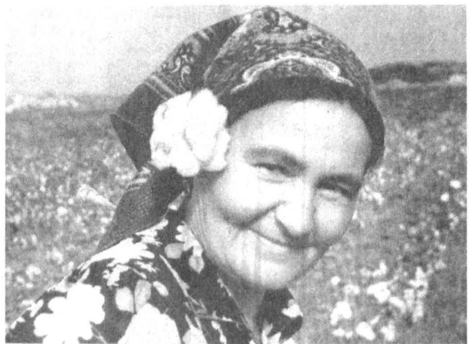
«ПАХТА - 98»

Улуғнор туманидаги «Шахрихон» ширкат хўжалиғи пахтакорлари бу йил 1509 гектар ерда гўза ўстиришди. Эрта баҳордан 24 центнерлик маррани кўзлаб иш олиб борилди. Бугун хўжалик далаларида бўлган кишининг кўзи қувнайди. Чунки ҳосил мўла.