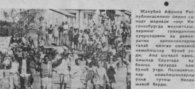
Жанубий Африка Республикасининг илмий сановат маркази «ЮН» Инженсбургда меҳнатда. Эришган грандиозлик вақтинчалик ва демократик эришилган талаб қилган оммавий намоишлар бўлиб ўтди. Ана шундай намоишлар Сузогада ва бошқа ерларда ҳам бўлиб ўтди. Полициялар намоишчиларини ўқитиш билан жавоб берди.

ВАРШАВА. Бу ерда ўтган беш йилда «Энг яхши рационализатор ва ижтироич» деган ном учун Умулполия миёсида ўтказилган конкурсда 225 миңга яқин киши ва 4,5 миңдан ортиқ техниклар клуби қатнашди. 1971—1975 йилларда улар жа ми халиқ хўнажигига 2 миң миңга злотих фойда келтирган 784 миң рационализаторлик тақлифларини киритдилар.