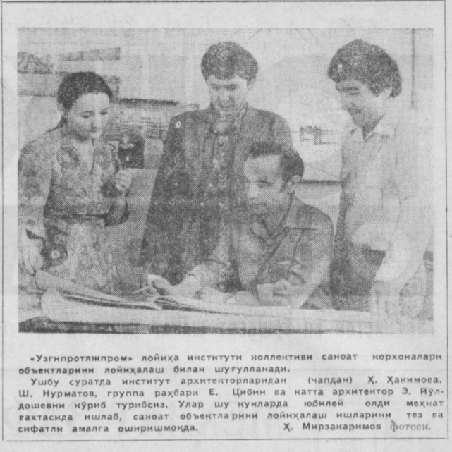
«Узгиротлинпром» лойиҳа институти коллективи саноят норхоналарини об'ектларини лойиҳалаш билан шуғулланади.