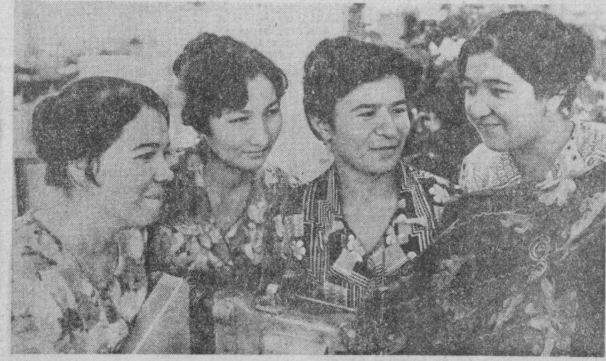
Тошкент буюмлар фабрикасида ўрта манба ва хунар-техника билим юрталари тасмоллаб ишлаётган ёшлар кўли.