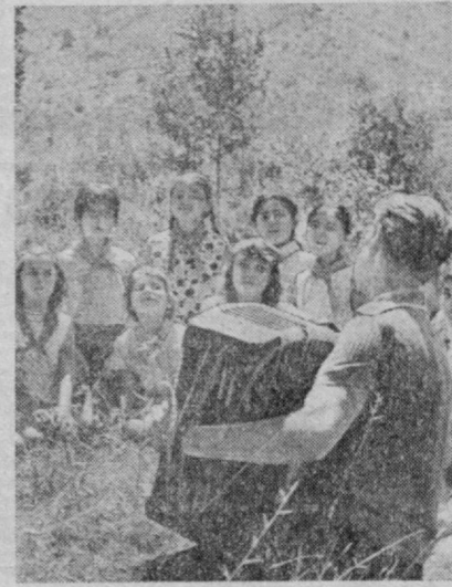
«Главташкентстрой» 153-трестига қарашли «Солнечный» пионер лагери Чимёнинг хушман-зара бурчаларидан бирига жойлашган. Ҳозир бу ерда бинокорларнинг фарзандлари мириқиб ҳордиқ чинаришмоқда. СУРАТДА: «Июссом» отрядининг пионерлари дам олиш вақтида.

Малагасия Республикасиغا Аэрофлот самолётлари мунтазам қатнай бошлади. Шу билан Аэрофлот самолётлари 79-мамлакатга қатнайдиغان бўлиб қолди. 12 июль кўни Москвадан Антанариувага «ТУ — 154» кўп ўринли ҳаво кемаси биринчи бор парвоз қилди. Самолёт Коҳира, Аден ва Могадишода қўниб ўтади. 9790 километрик мисофани лайнер 12 соат учинч вақти давомида босиб ўтади.