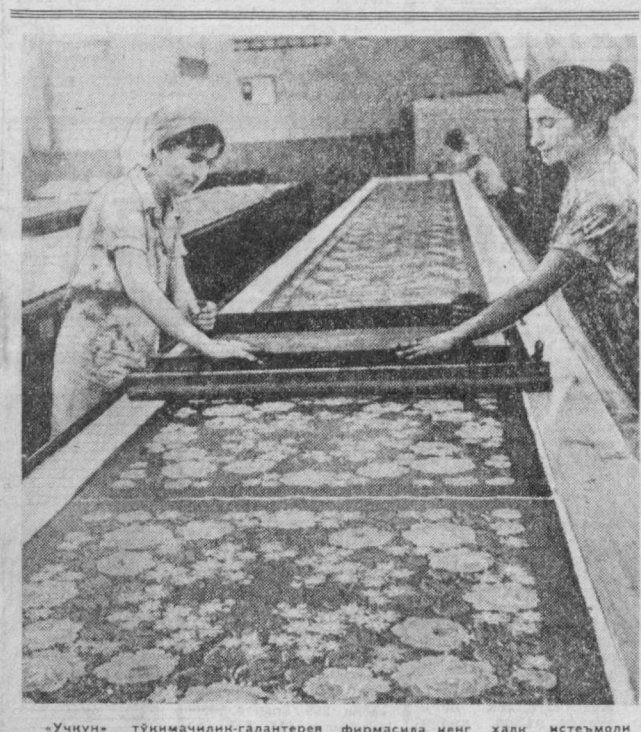
«Учун» тўқимачилик-гаплетер фирмасида кенг халқ истеъмоли бўюмлари ҳам кўплаб ишлаб чиқаришмоқда.

Куйбишев шоссесидagi янги кўприк курилган низога етказилди. Шаҳар ҳудудиндаги энг йирик объектлардан бири ҳисобланган бу кўприкнинг аҳоли учун асосли бўлаётган курилиш келтирилган 14 август — қурувчилар байрами кунда қўрилди.