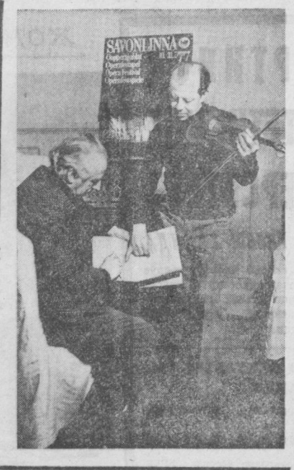
Д. Д. Шостакович номидаги Ленинград филармониясининг академик симфоник оркестри...