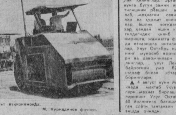
СУРАТДА: кўприкни асфалт етишилмоқда.

«Уроқ» Л. И. Брежнев мактаб ўқувчилари меҳнат бирлашмалари Бутуниттифок сплэтининг катнашчиларини астойдил ва саманий табриқланди. «Анза дустлари» — дейилган жумладан табриқда. — Совет халқининг коммунизм йўлидаги меҳнат зафарларини эстафетасини сиз, йиллар қабул қилиб олсанлар. Совет Ватанимизни севишлар, унинг қудратини ва равақатини тўғрисида гамгўрлик қилишлар. Эртанги кунга бугун замин яратилишини рўшдан англаб, меҳнатни севишлар ва ҳурмат қилишлар, билим чоғиданок ҳар қандай ишни кўнгилдагидек қилиб бажаришга, маънафига фойда етказишга итилинглар.