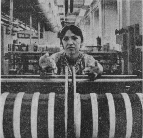
Шаҳримиздаги «Малина» трикотаж ишлаб чиқариш бирлашмаси коллективини Улуғ Октябрнинг 60 йиллиги шарафига меҳнат ваҳтасида тўриб ишламоқда. Корхонанинг кўпгина ишчилари ва айрим бригадалари байрам кунингача икки беш йиллик план-топшириқларини бажаришга аҳд қилишган.

Улуғ Октябрнинг 60 йиллиги байрамини муносиб кутиб олишга аҳд қилган шаҳар ободонлаштириш Бош бошқармасининг «Гордорстройремонт» трести ва кўчаларнинг таъмир-яратилари бўшқармаси коллективлари шу кунларда пойтахтимизнинг магистраллари ва кўчаларида йирик ҳажмда ремонт ишларини олиб боришмоқда.