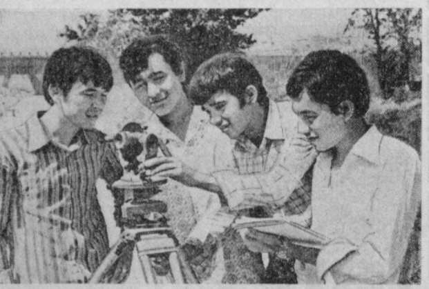
Беруний номидаги Тошкент политехника институтининг кўнгилли факультетларининг студентлари шун кунларда ўқув практикасида қатнашмоқда. Мана бу фотодо ҳақиқат шун қилиниши аниқланади. Иккинчи курс студентларидан бири группанин турли шикоятларидан биринчи навабчилик ўқув практикаси марафатида кўриб турибди. Бу студентлар ўқув турли шикоятларини белгилаш устида машғул ўтказмоқда.