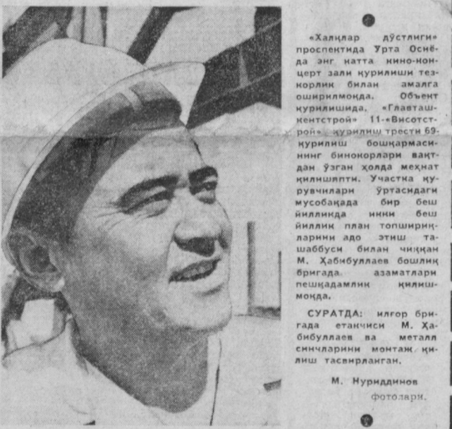
«Халқлар дўстлиги» проспектида Урта Осиёда энг катта инно-цент зали курилши тезкорлик билан амалга оширилмоқда.