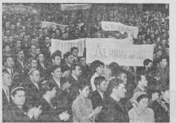
Санъат саройида республика ёш механикаторлари сўбатининг тантамаси очилиши.

Пойтахт аҳолиси Тошкентни қайта тиклаш учун Харьковдан келган бинкорларни кутиб олмади.