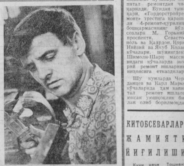
Мана бу юксак мажбуриятларини бажариш ва янада кўпроқ меҳнат унумдорлигига эришиш йўлида астойдил меҳнат қилмоқдалар.

Мамлакатимиз пахтакорлари ва қишлоқ меҳнатчиларини учун қўйлаб «Т—28X4M» ва «МТЗ—80X» маркали 60 ва 80 от кучига эга бўлган ҳамда янги принциплар тайёрлаб бериётган СССР 50 йиллиги номида Тошкент трактор заводининг азамат тракторсозлар коллективи Улуғ Октябрьнинг 60 йиллиги юбилей шарафига бошланган умумхалқ муносабатини тобора кенг қулоқ ёйдирмоқдалар. Корхона ишчиларининг ҳар бири шонли санага бағишлаб ўз зиммаларига охиригача социалистик мажбуриятлар қабул қилишган. Улар бу юксак мажбуриятларини бажариш ва янада кўпроқ меҳнат унумдорлигига эришиш йўлида астойдил меҳнат қилмоқдалар. Коллективнинг шу кунларда қўлга киритган юксак кўрсаткичлари эътиборга олинган тракторсозлар коллективни белгилаган мўдатда шараф билан бажарилишидан далолат бериб турибди. Корхонанинг барча цех ва участкаларида қизғин меҳнат вахтаси давом этмоқда. Корхона тракторсозлари мамлакатимизга ягона бўлган Ворошилов но-