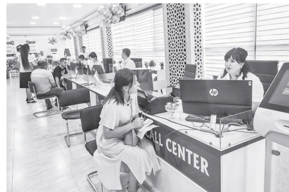
Икки қаватли иншоот ҳар томонлама қўлай ва замонавий кўринишга эга. Унинг очилиш маросимида сўзга чиққанлар мазкур бинонинг қурилган, ислохотларнинг амалдаги самараси сифатида аҳоли манфаати йўлида хизмат қилиши, яратилган шароитлар хусусида таъкидлаб ўтишди. Ойнадек яряқираб турган зиналардан кўтарилиб хоналарни кўздан кечирган меҳмонлар юқори таассуротга эга бўлишди.

Зарафшон шаҳрида 85 мингдан ортиқ аҳоли истиқомат қилади. Аҳолининг давлат хизматлари олишга бўлган эhtiёжи ҳам шунга яраша юқори. Мустақилликнинг 31 йиллиги байрами арафасида қуриб фойдаланишга топширилган шаҳар адлия бўлими биноси фуқаролар учун чинакам тўхфа бўлди.