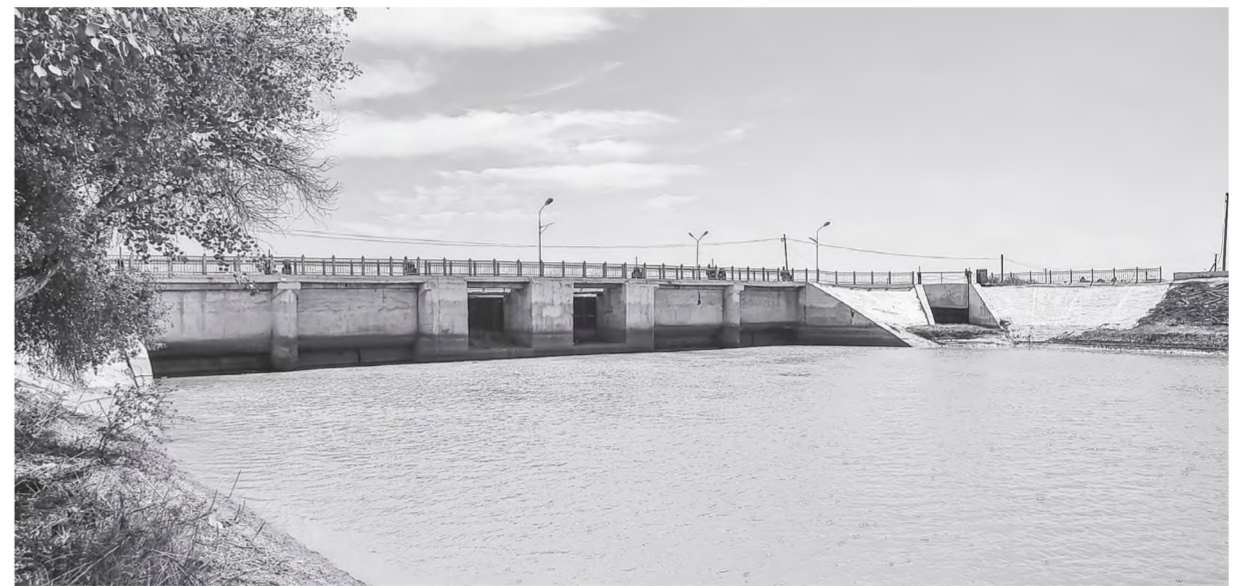
Суратларда: ҳозирда гидроузельнинг "Кегейли" канали сув тақсимлаш бош иншоотида таъмирлаш ва автоматлаштирилган бошқариш тизимини жорий қилиш бўйича кенг кўламли иш олиб борилмоқда. Мақсад ХАБИБУЛЛАЕВ (ЎЗА) олган суратлар.

Таъкидлаш жоиз, "Қуваниш-жарма" каналига Корея халқаро ҳамкорлик агентлиги KOICA грант маблағлари ҳисобидан "Ақли сув" қурилмаси ўрнатилган бўлиб, ушбу қурилма ёрдамида реал вақт режимида сувни назорат қилиш, ҳудудларга етказиб берилаётган сув ресурсларини онлайн кузатиб бориш ҳамда сувнинг аниқ ҳисоб-китобини юритишга эришилмоқда.