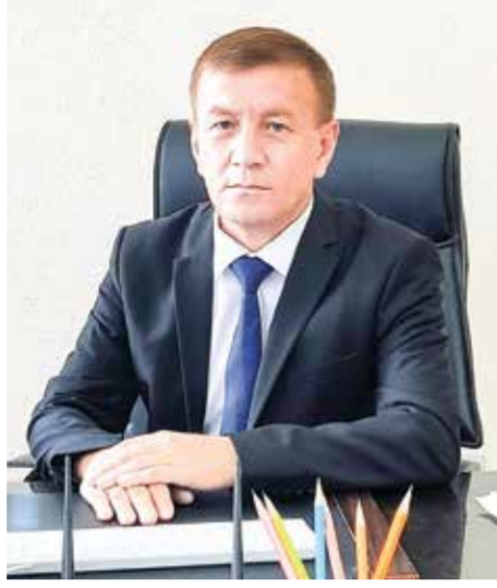
ган барча ютуқлар ислохотлар самарасидир.

Давлатимиз иқтисодий ривожига улкан ҳисса қўшаётган қурилиш соҳаси сўнгги йилларда ривожланишнинг янги босқичига кўтарилди. Буни шаҳар ва қишлоқларнинг кўркми қиёфасида, аҳолининг фаровон турмуш тарзида кузатиш мумкин. Бошқа тармоқлар каби қурилиш соҳасини ривожлантиришга ҳам алоҳида эътибор қаратишда. Тизимни янада такомиллаштириш учун давлатимиз раҳбарининг фармон ҳамда қарорлари қабул қилинаётган тармоқда ислохотлар самарадорлигини оширишда асосий ўрин тутаяпти, бунёдкорлик ишлари тобора кенгаймоқда.