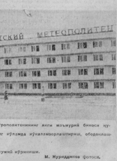
Кун-кеча Тарас Шевченко кўчасида Тошкент метрополитенининг янги маъмурий биноси курилди, фойдаланишга топшириди. Ҳозир бу ерда кенг кўламда кўналамзорлаштириш, ободонлаштириш тадбирлари олиб борилади.

С t u d e n t l a р 1970-й и l n и n 4 м a й d a м и d l i й g a р d и c o л d a t l a р и c t u d e n t l a р и n g у р u ш t a қ a р ш и n a м oй и ш и қ a t n a ш ч и l a р d a n tў r t k и ш и n и y a d i r g a n ж oйд a м a z m u p и l t и n g c п o р t л a t k u р и ш t a й q a қ a g a n ч и r o r i q a қ a р ш и n o c o c и c t и k б и n d o m o d a l a р.