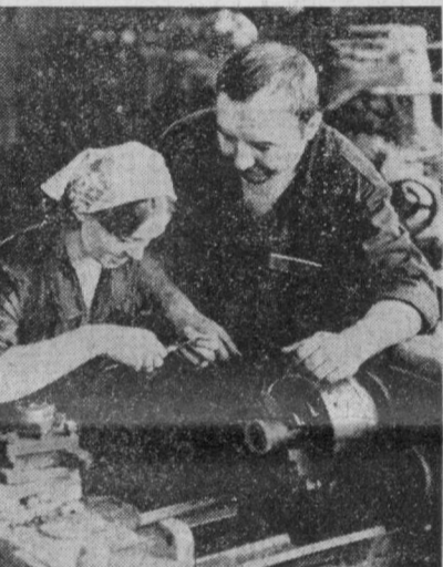
Узбекистон ССР 50 йиллик номи Ташкент лан-бўёғ заводи бир кунда 250 тоннага яқин турли хил бўёғ маҳсулотлари ишлаб чиқаради. Шу кунларда завод коллективи Улуғ Октябр Социалистик революциясининг 60 йиллик юбилейини кутиб олшга қизғин тайёргарлик кўрмоқда.

Ш у н с и қ у в о н a р l i қ n и, ҳ o з и р г и к у н d a 1-п o л a ф a z l a ф a б р и к a с и 16 х и л м o d e л l a t i п o л a ф a z l a м o d e л l a t i С и ф a t б e л г и с и б и л а н ч и қ a р m o d a.