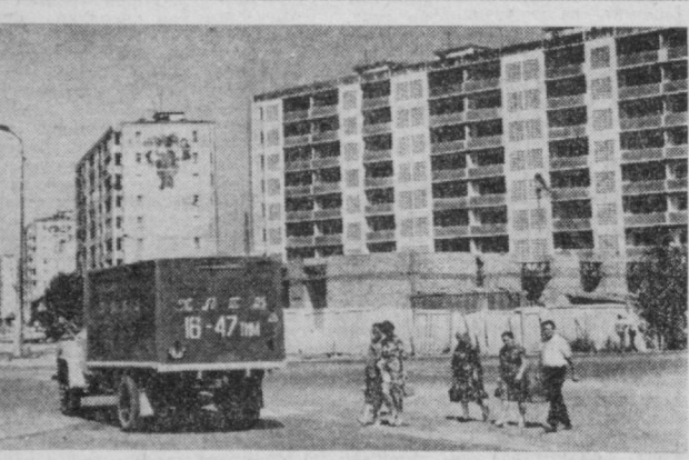
Шахримиз тобора обод ва кўркам бўлиб бормоқда. Бу ерда кенг кўламли турар жой бинолари, маданий-машия объектлар бунёд этилиб фойдаланишга топширилмоқда.