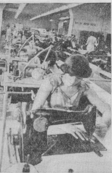
«Кизил тоғ» бирлашмаси коллективи кенг истеъмолат товарлари ишлаб чиқариши кўпайтириш ва сифатини яхшилаш борасида фидокорона меҳнат қилмоқда.