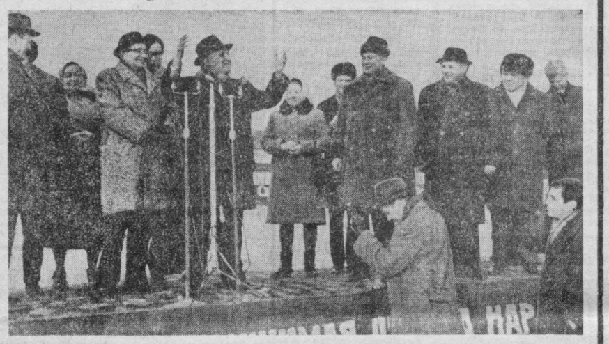
Тошкентлик ўқувчилар учун Болгария қурувчилари томонидан бунда этилаётган мактаб пойдеворининг қўйилишига бағишланган митинг. Тодор Живков нўт сўзламоқда.