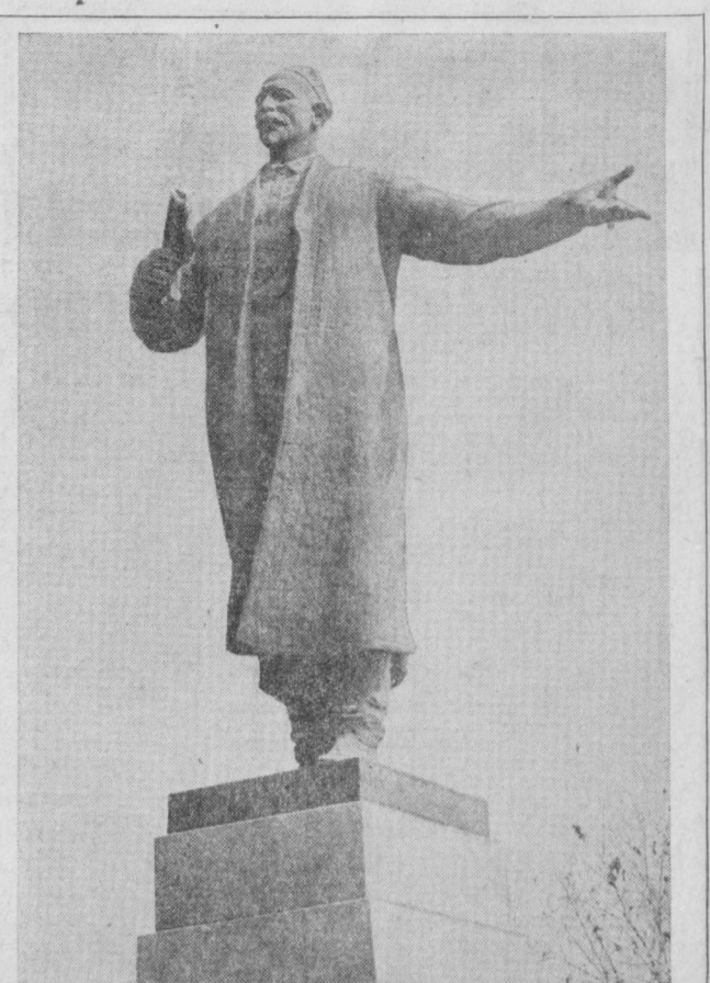
Республикаимизнинг биринчи президенти И. Охунбоев хотирасига ўрнатилган ҳайкал.

Район Тошкентнинг жануби-ғарбий қисмида жойлашган. 1929 йилда Эски шаҳар райони асосида ташкил этилган. Унинг территорияси 3.342 гектар, аҳолиси 283 минг, 80 процентга яқинини маҳаллий миллат вакиллари ташкил этади. Район территориясида 22 та энергетика, енгил, озиқ-овқат, маҳаллий саноат, мебель, ёғочни қайта ишлаш саноати, полграфия, транспорт, алоқа корхоналари, ўнга яқин қурилиш-монтаж трестлари, талайгина лойиҳа ташкилотлари, билим юрталари жойлашган. Районда 52 та умумтаълим мактаби бўлиб, унда 47,5 минг ўқувчи ўқийди, 10 минг ўқувчи 50 та мактабга борадиган муассасаси, 56 минг студент ўқийдиган 12 та олий ва ўрта махсус ўқув юрти, 7 минг мутахассис ишлайдиган 5 та илмий-тадқиқот институти, 20 дан ортиқ медицина муассасаси, талайгина санаторийлар, маданий-оқартув муассасалари, напирётлар, 500 га яқин саёдо ва умумий овқатланиш корхонаси, 26 ётқоҳона бор.