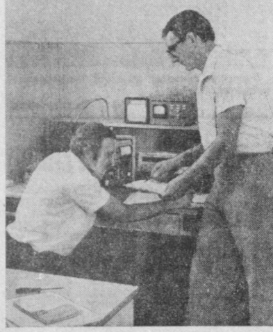
Сунгги пайтда корхона айрим приборларини ишлаб чиқаришдан, технология жараёнларини автоматик назорат қиладиган ва бошқарадиган системаларини ишлаб чиқаришга киришди. Жумладан, флоторентгенларни ўлчашнинг автоматик системаси (АДФР-4 типидаси) ўзлаштирилган. Ҳозир бу ҳақда қосқак даржадаги аниқликда хабар беради. Металлургияда, гидротехникада, нурилли материаллардаги тўроқдаги наминг даражасини билиш го-ят муҳим. Нейтрон нам ўлчигич «Нейтрон-3» бундай маълумотларни дарҳол беради. Сунгги пайтда кор-

хона айрим приборларини ишлаб чиқаришдан, технология жараёнларини автоматик назорат қиладиган ва бошқарадиган системаларини ишлаб чиқаришга киришди. Жумладан, флоторентгенларни ўлчашнинг автоматик системаси (АДФР-4 типидаси) ўзлаштирилган. Ҳозир бу ҳақда қосқак даржадаги аниқликда хабар беради. Металлургияда, гидротехникада, нурилли материаллардаги тўроқдаги наминг даражасини билиш го-ят муҳим. Нейтрон нам ўлчигич «Нейтрон-3» бундай маълумотларни дарҳол беради. Сунгги пайтда кор-