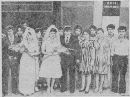
1977 йил 1 январдан бошлаб НИКОХ — ШОДИЁНА СТРАХОВАНИЕСИ ТУЗИЛМОҚДА

Страхованиенинг бу янги тури тўй шодиналарига сарфланадиган маблағни жамғарнишга имконият яратиб беради.