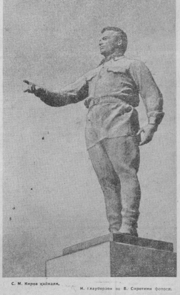
С. М. Киров ҳайкали, И. Глауберзон ва В. Сиротнин фотоси.

вонидан совет қўшинларининг қаҳрамони ўтишини ташкил қилди.