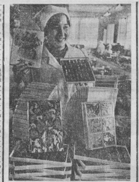
Райондаги кенса корхоналардан бири «Эр-Тон» кондитер фабрикасида маҳсулот сифатини оширишга ната эътибор берилмоқда.

қурилган бўлиб, коммунал кўчаларнинг барча тўрлари билан янги тўлдирилган йилнинг фахр билан айта оламиз.