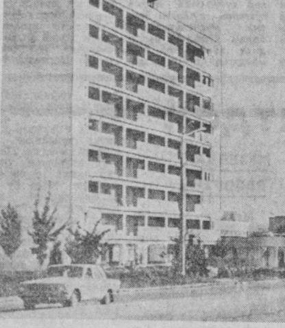
Шундай эди — шундай бўлди

ни максимал даражада автоматлаштиришга эришилмоқда. Ишчи маҳсулотига бўлгани учун бригаданинг ҳақиқий усталари йилнинг 100,2 процент бажарилиши бўлди.