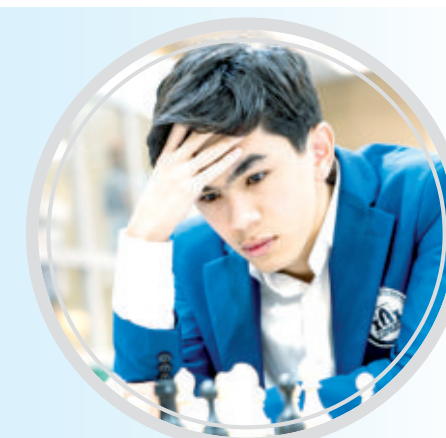
Жаҳоҳир СИНДОРОВ, Шахмат бўйича Олимпиада чемпиони:

— Айни пайтда кайфиятимиз жуда аъло. Бунақаси бўлмаса керак дейману, лекин кейинги мусобақаларда ҳам биринчилиكنи қўлдан бермасликка ҳаракат қиламыз. Босим жуда кучли бўлди. Бундай натижа қайд эта олишимизни ўзимиз ҳам кутмагандик. Биз