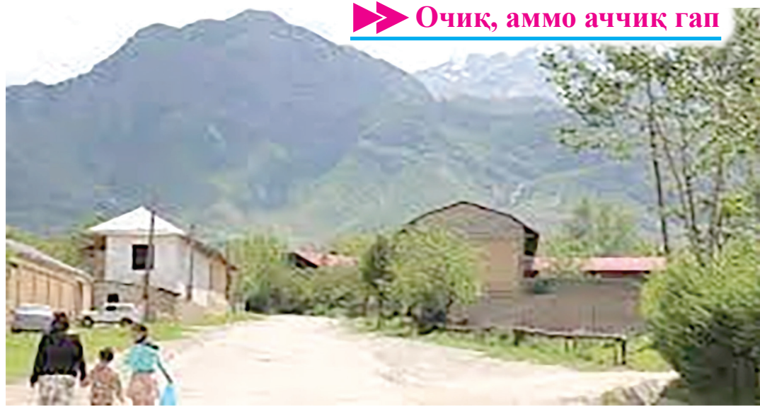
Очиқ, аммо аччиқ гап

Ҳозирда интернет орқали ахборот тарқатиш оламшумул тўс олди. Бир ёшга қирин боланинг телефон беришларини сўраб гашлагани, қўлига олгач, тўғмаларини босиб, ўзига керакли саҳифани очганига гувоҳ бўлдим. Дарҳақиқат, ҳозирда кафтга жой олгудек миттигина жиҳоз бажараётган амалларнинг саногига етиб бўлмайди. Соатдан тортиб қийлономагача турли ашёларни, илм-фанга доир китобларни, тадбири кўрсатмаларнинг барини ўз кўриниши катталигида бир жойга жамланса, тоғдай уюм ҳосил бўлади. Вақту