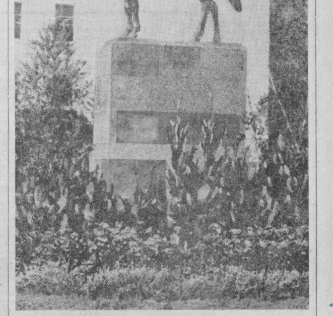
М. В. ФРУНЗЕГА УРНАТИЛГАН ҲАЙКАЛ.

1920 йилнинг 22 февралда В. И. Ленин томонидан имзо чекилган мандатга биноан М. В. Фрунзе дала штаби билан бирга Самарадан Тошкентга келди. Туркистон фронтининг штаби Маҳрам (ҳозирги «Правда Востока» кўчасидаги «Шарқ» меҳмонхонаси)да жойлашган эди. Михаил Васильевич Фрунзе шу ердан Фарғонага—Семиречеге борган. 1920 йилнинг 12 июлида Верний (ҳозирги Олмаота шаҳри)да қўнрилиш қўғалонини бостиринишга худди шу ердан жўнаниб эди.