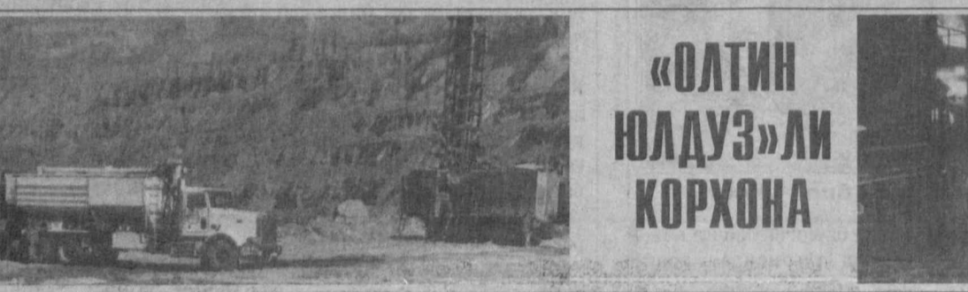
«ОЛТИН ЮЛДУЗ»ЛИ ҚОРХОНА

Куриниб турибдики, меҳнатқарор қабул қилиш, уларнинг ариза ва шикоятлари билан ишлашда бартараф этилиши лозим бўлган масалалар оқ эмас. Раёсат уларнинг ечимини тезлаштиришга қаратилган қарор қабул қилди. Ж. САЪДУЛЛАЕВ