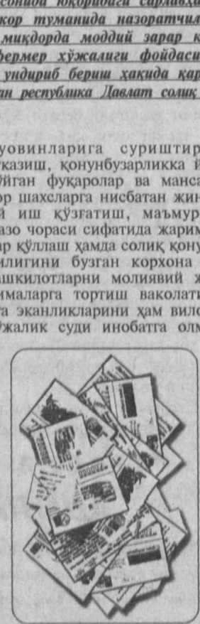
ГАЗЕТАНИНГ ШУ ЙИЛ 10 ДЕКАБРЬ СОНИДА ҚОРХОНАДА САРВАХАЛ ТАНҚИДИЙ МАҚОЛА ЧОП ЭТИЛГАНДИ. УНДА ЖИЗЗАХ ВИЛОЯТИ ПАХТАКОР ТУМАНИДА НАЗОРАТЧИЛАР ТАДБИРКОР ФАЛОАТИЯГА АСОСИЙ АВАЛАШТИРУВ ТЎҒРИСИДА ГИНА ҚАТТА МУКОБОРА МОДИЙ ЗАРАР КЕЛТИРИЛГАНИЛИ, ОҚИБАТДА ЖИЗЗАХ ВИЛОЯТИ ХЎЖАЛИК СУВИ «СЕМЬЯ» ФЕРМЕР ХЎЖАЛИГИ ФОЙДАСИГА ЖАВОБГАР — ШУ ТУМАН СОЛИК ИНСПЕКЦИЯСИДАН 500 МИҢГ 800 СЎМ УНДИРИБ БЕРИШ ҲАҚИДА ҚАРОР ЧИҚАРИЛГАНИ ҲАҚИДА ГАП БОРГАН ЭДИ. ТАКШИРУВ УШБУ МАҚОЛА ЮЗАСИДАН РЕПУБЛИКА ДАВЛАТ СОЛИҚ ҚЎМИТАСИ РАИСИ В. С. БЕТАНОВДАН Қўриқса маъмуриятга жавоб хати олдди.

қонунига мувофиқ давлат солиқ хизмати ходимлари ўз хизмат вазифаларини бажариши чориде давлат хожимини вақили хисобландилар. Солиқ суди ҳам ишнинг қўришда ушбу ҳаққоний ҳолатларни чуқур таҳлил этмаган ва инобатга олманган. Шунинг учун ҳам Пахтакор туман давлат солиқ инспекциясини хисобидан «Семья» фермер ҳужалиги фойдасига 500 миңг 800 сўм ундириб беришга қаратилган қарори асосланиб. Бундан ташқари Ўзбекистон Республикасининг «Давлат солиқ хизмати тўғрисида»ги қонунига мувофиқ республика Давлат солиқ қўмитаси ва унинг тизимидаги ҳудудий давлат солиқ хизматлари ягона назорат қилувчи орган хисоблангани, давлат солиқ хизматлари бошлиқлари ва уларнинг