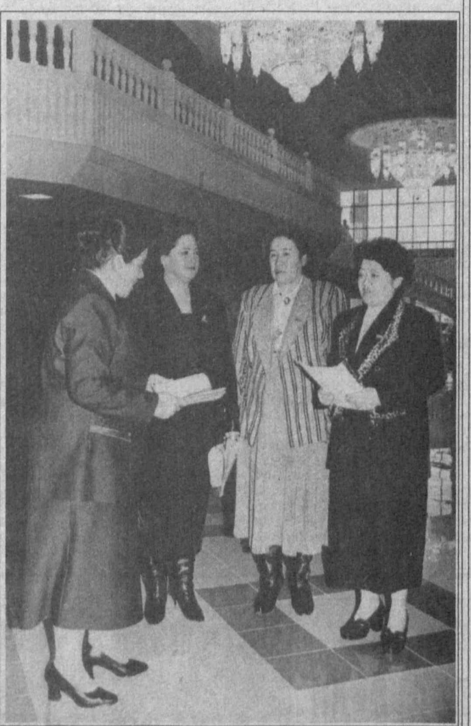
СУРАТДА: депутатлардан бир гуруҳи.