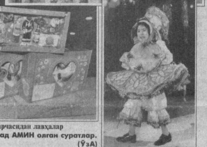
СУРАТЛАРДА: Президент арчасидан лавҳалар