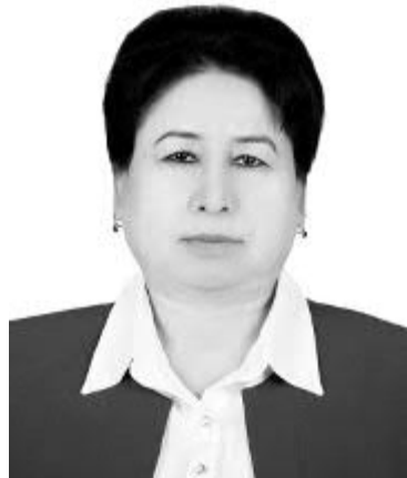
Назира МАТЯҚУБОВА, Қорақалпоғистон Республикаси Жўқорғи Кенгеси депутаты, Ўзбекистонда хизмат кўрсатган журналист:

— “Янги Ўзбекистонда эл азиз, инсон азиз”. Искот учун мисолларни олишдан излашнинг асло ҳождати йўқ, ҳар биримиз шундоққина ён атрофимизга теран назар ташласак бас.