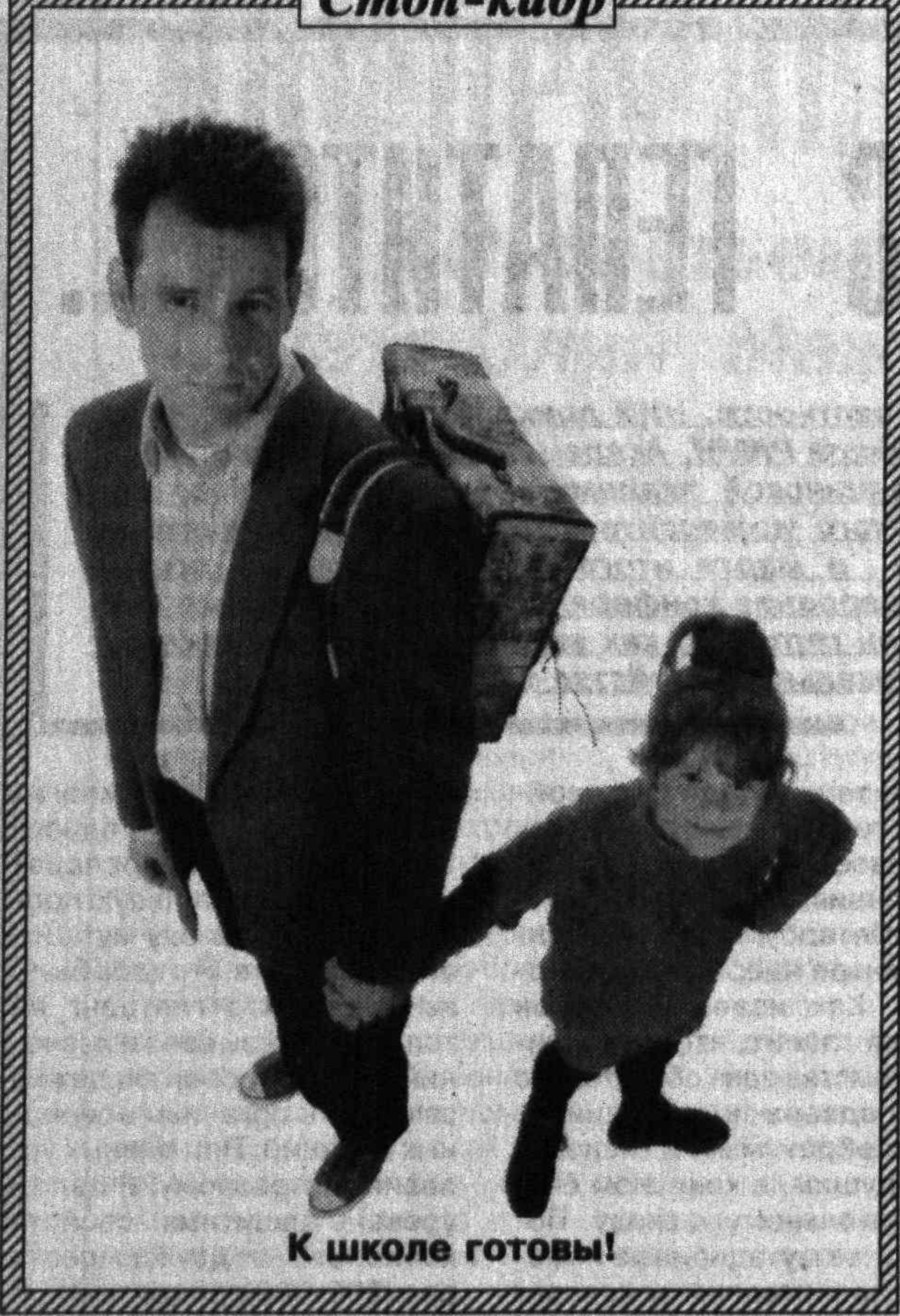
К школе готовы!