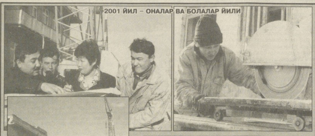
2001 йил - ОНАЛАР ВА БОЛАЛАР ЙИЛИ

● Мамлакатимиз Президентини Ислам Каримов номига Қурбон ҳайити муносабати билан Туркменистон Президентини Сапармурод Ниязов, Қирғизистон Республикаси Президентини Аскар Акаев, Марокаш Подшоҳи Муҳаммад Олтинчи, Яман Республикаси Президентини Али Абдулло Салих, Саудия Арабистони Подшоҳлиги Валиаҳди, Вазирлар Маҳкамаси раисининг ўринбосари, Миллий гвардия бошлиғи Абдуллох бин Абдулазиз ас-Сауд, Бирлашган Араб Амирликлари Вице-Президенти ва Бош вазир Шайх Мақтум бин Рошид ал-Мақтум, Туркия Республикаси Бош вазирини Булент Ўжевит, Қувайт Давлати Валиаҳди ва Бош вазирини Саъд ал-Абдуллох ас-Салим ас-Сабоҳлар самимий табрик йўллашди.