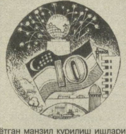
ОЗОД ЮРТНИНГ ОБОД ГЎШАЛАРИ

Ана шундай янги куриб битказилган гузарлардан бири Жиззах шаҳридаги Раваллик гузаридир. Мазкур гузарнинг алоҳида хислатларидан бири шундаки, аввалги кўримсиз бўлиб ётган манзил курилиш ишлари битганидан сўнг алоҳида чирой очиб, мафтункор бир масканга айланди. Айни шундан ташқари, алоҳида алоҳида хислатларидан бири шундаки, аввалги кўримсиз бўлиб ётган манзил курилиш ишлари битганидан сўнг алоҳида чирой очиб, мафтункор бир масканга айланди. Айни шундан ташқари, алоҳида алоҳида хислатларидан бири шундаки, аввалги кўримсиз бўлиб ётган манзил курилиш ишлари битганидан сўнг алоҳида чирой очиб, мафтункор бир масканга айланди.