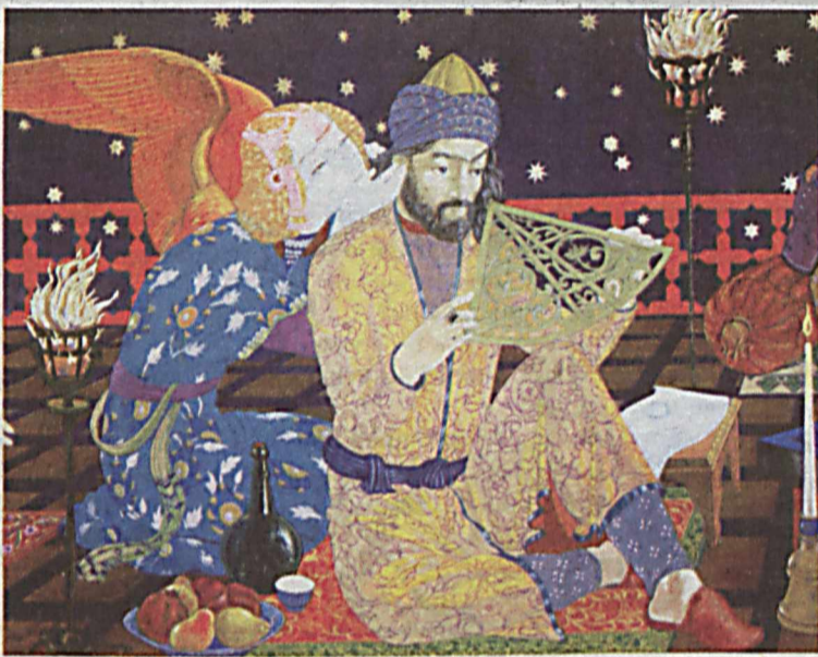
Фреска "Торжество человеческого разума - Восточный ренессанс" (Таджикистан)

Огромное благо, что в нашей стране во главу угла ставят важнейшие ценности, особенно семью, определяющую жизнь человека в дальнейшем, развитии современного общества. Что у нас царят мир и спокойствие, что служит для всех нас, особенно для творческих людей, огромным стимулом. Как глоток свежего воздуха, который мы все должны ценить.