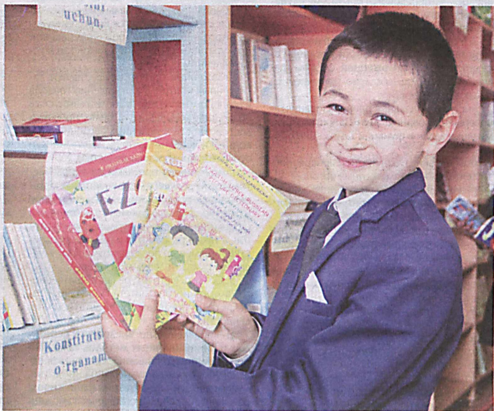
■ Андижанским областным управлением внутренних дел и его районными и городскими отделами в рамках секторов ведется широкомасштабная работа по организации книжных магазинов.

По области открылись 17 новых книжных магазинов. Кроме того, в Кургантепинском районе двоим предпринимателям оказано практическое содействие в выделении территории для их строительства.