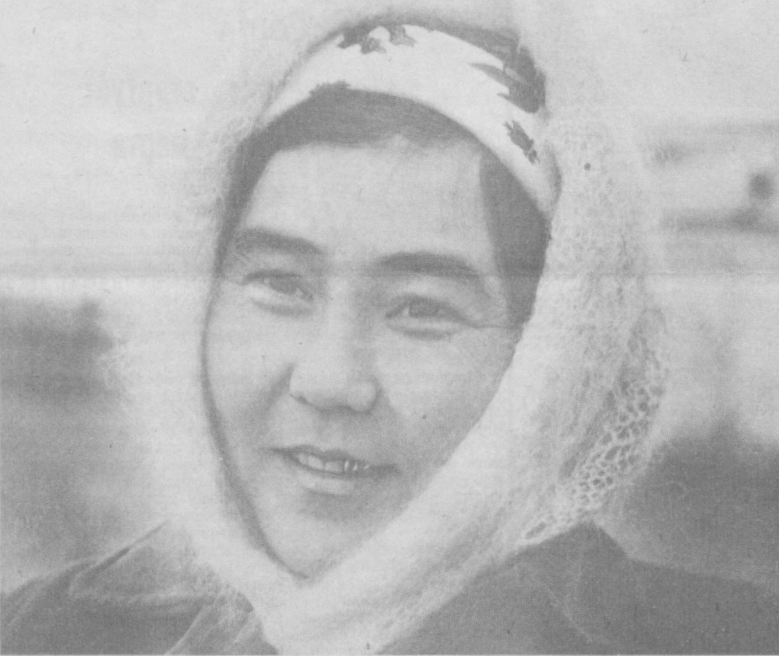
Крупным планом НА ПОКРЫТОЕ СНЕГОМ ПОЛЕ

В решении этих и многих других вопросов рассчитываем на помощь заинтересованных организаций, в первую очередь Госплана, Госназба, агропрома. Без них, во всем нам не справиться. Борьбу с перекупщиками мы должны в первую очередь использовать экономические рычаги.