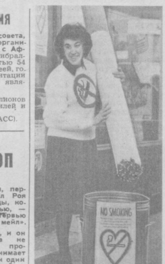
В Англии ширится борьба с курением. Активисты антитабачной кампании выступают за уничтожение всей табачной рекламы, организуют акции солидарности, привлекают внимание граждан на опасность, которую несет никотиновый яд личности, несет обществу в целом.