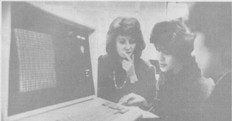
Сейчас у студентов Ташкентского электротехнического института связи одна работа — читать лекции, а другая — решать задачи. Например, на экзамене по физике.