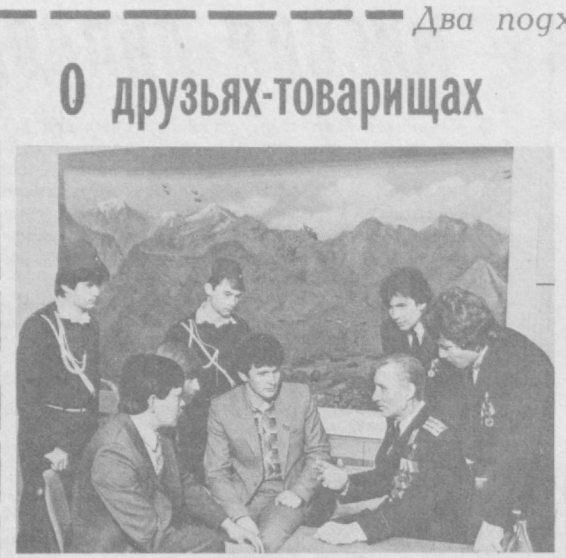
«Пламя», что при Доме пионеров, собрали фотографии и документы, крупные предприятия района перечислили деньги в фонд музея. Художники комбината «Рассом» создали диараму боя. Привлекают внимание посетителей памятная мемориальная доска, биографические материалы, газетные и журнальные публикации о мужественных и смелых парнях.

Экспозиция, открывшаяся в Хамзинском Доме пионеров, особенная. Она хранит священную память о молодых парнях, погибших в Афганистане, рассказывает об их однополчане, которым посчастливилось выжить. Двадцать восемь воинов из одного только Хамзинского района погибли в Афганистане. Их оставшихся в живых друзья и юноремейцы штаба