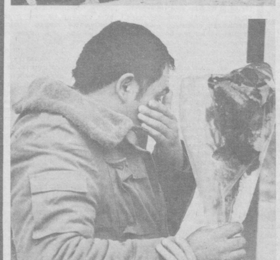
Так ждали и встречали воинов-афганцев в Термезе.