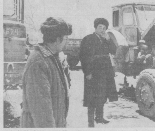
НАМАНГАНСКАЯ ОБЛАСТЬ. Предпоследнее место в списке о ремонте сельскохозяйственной техники занимает Чустский район. Нельзя сказать, что во всех хозяйствах дела идут плохо. В колхозе имени Калинина, например, работа кипит: уже восстановлена почти вся техника. Скоро здесь отработают о все полной готовности. Ремонтники созданы все условия и для работы, и для отдыха. Слесари и механикаторы обеспечены горячим обедом.

Серьезному критическому осмыслению после выхода постановления Бюро ЦК Компартии Узбекистана подверглась вся идейно-воспитательная работа. — Идеологическая работа больше всего пострадала за годы застоя, более всего оказалась запущенной, отошла куда-то на второй план. Идет ли сегодня поиск новых форм и методов этой работы? — Конечно. Они появляются. И такие, о которых мы в свое время незаслуженно забыли. Я прежде всего имею в виду индивидуальную работу с людьми. Стали проводить «круглые столы», встречи по месту жительства, с творческой интеллигенцией. То есть по категориям. Собирали, к примеру, участковых инспекторов. И сколько нового для себя узнали. Встретились с работ-