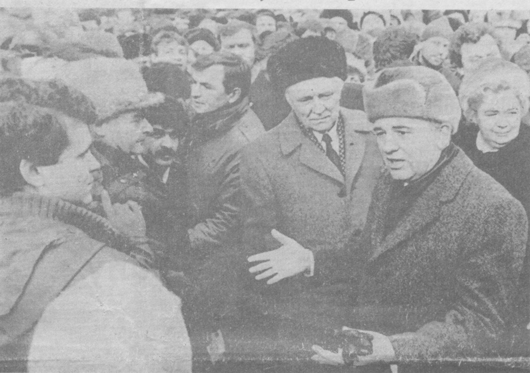
На снимке: во время встречи с киевлянами на Крещатику.

Высокое качество машин, механизмов, оборудования, снижение их металло- и энергоемкости — вот что такое сегодня перестройка в индустрии, модернизация ее ведущих отраслей. Что же мешает оперативно воплощению научных разработок в новые машины и технологии? Если сегодня в этом тщательно не разбираться, не выявят самые узкие звенья в цепи научно-технического прогресса, отставание от мирового уровня