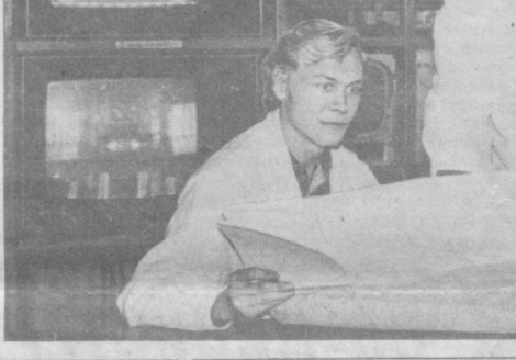
Надежную теле- и радиотрансляцию всесоюзных, республиканских и местных передач обеспечивает слаженная работа коллектива Андижанского телецентра.