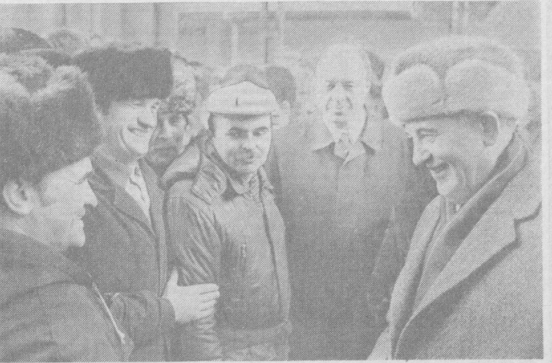
Во время посещения научно-производственного объединения «Электрон».

Голое: Счастья Вам, Михаил Сергеевич, крепкого здоровья, всего самого-самого доброго! Двигайте перестройку, а мы Вам поможем, каждый своим трудом!