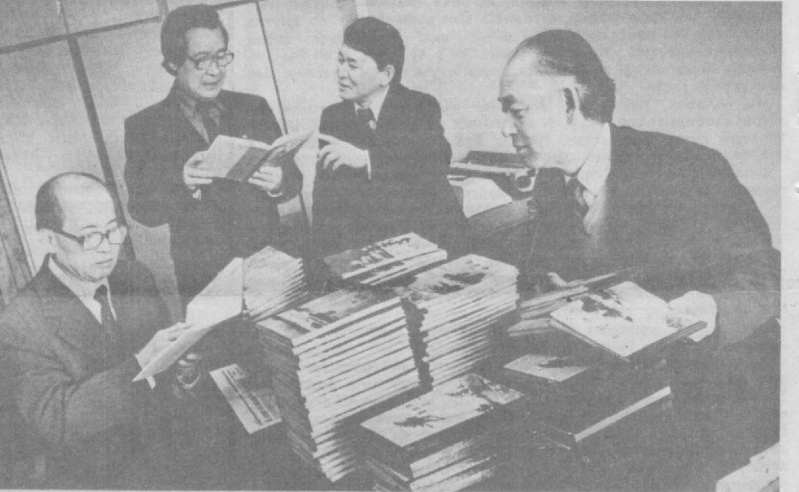
В конце прошлого года в Ташкенте был избран оргкомитет по созданию республиканского культурного центра советских киргизцев.

Пленум утвердил комиссию ЦК Компартии Литвы.