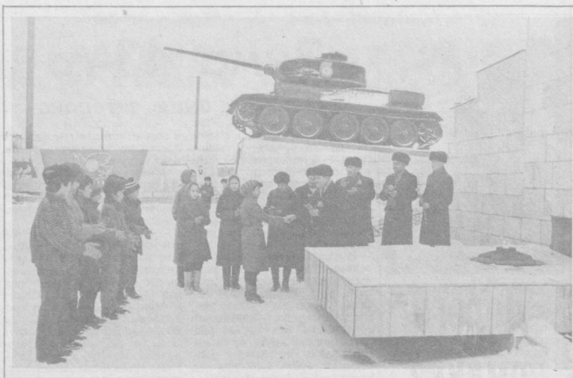
В канун празднования Дня Советской Армии и Военно-Морского Флота в Араванском районе (Киргизская ССР) состоялась встреча ветеранов Великой Отечественной войны из Андижанской и Ошской областей.

Учащиеся школ имени А. Дониша и Ю. Гагарина, что в Дехканабадском районе, перечислили на счет 70030 по 200 рублей.