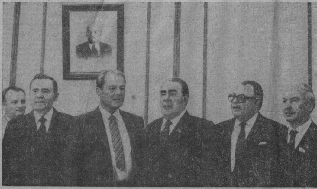
На снимке: перед началом беседы.