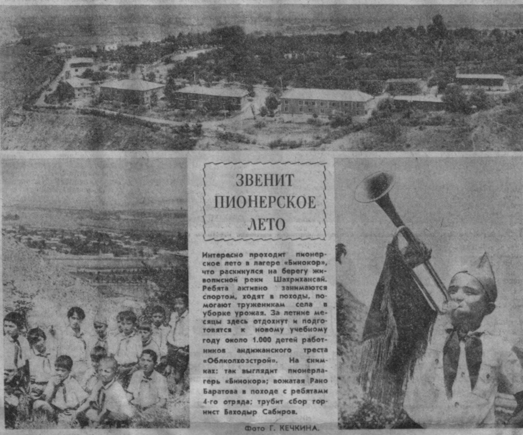
Интересно проходит пионерское лето в лагере «Бинокор», что раскинулось на берегу живописной реки Шахриханской.