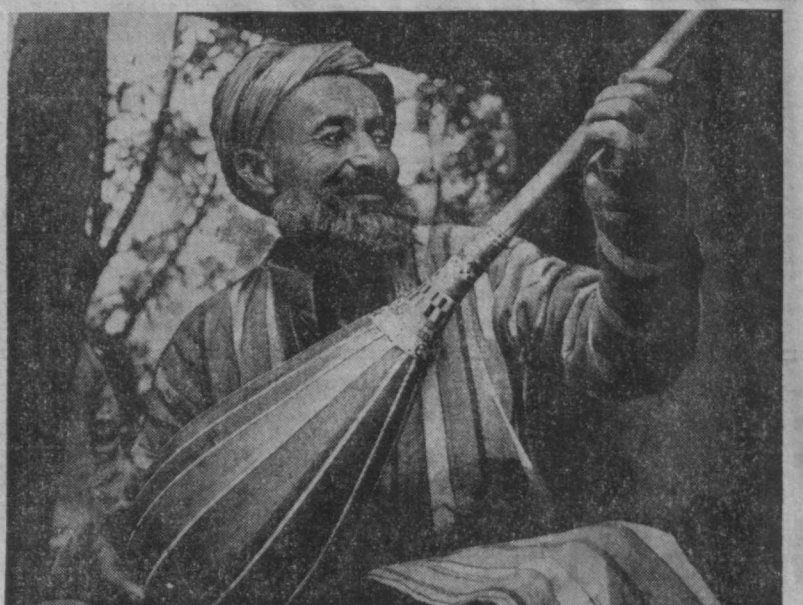
Народными умельцами славится село Гилан, что в Шахрисабзском районе Кашкадарьинской области. Жители этого высокогорного селения трудятся в совхозе имени К. Маркса...