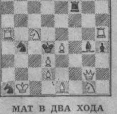
Мат в два хода