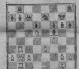
Позиция № 4