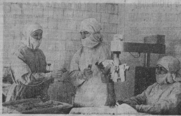
Оптимальный метод слонной операции по имплантации в глаз искусственного хрусталика одновременно с удалением катаракты освоили впервые в республике хирурги Ташкентской областной больницы. Помутневший глазной хрусталик они заменяют интраокулярной линзой, полностью восстанавливая при этом зрение пациента.